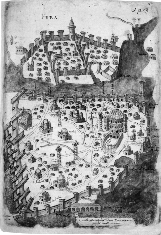
ŞEKİL 1. CRISTOFORO BUONDELMONTE KOSTANTİNİYYE HARİTASI 1422, LIBER INSULARUM ARCHIPELAI, METROPOLITAN MUSEUM, NEW YORK, DC.

Haritada Konstantiniye surları, hemen tüm anıt eserler ve evler oldukça doğru bir şekilde betimlenmişlerdir. Hemen dikkat çeken ayrıntı ev dokusunun ne denli düşük yoğunlukta olduğudur. Evlerin büyük çoğunluğunu tek katlı, çok az bir kısmı iki katlıdır. Gerçekten de bu özellik aşağıda ayrıntılı bir şekilde inceleyeceğimiz 1455 Tahririyle de doğrulanmaktadır. Buondelmonti ayrıca notlarında Konstantiniye’de üzüm yetiştirildiğini belirtir ve üç, dört farklı üzüm türünün varlığından söz eder. Hemen bütün sarnıçlar yıkık durumdadır. Buradan da Konstantiniye’nin sosyoekonomik çöküntüsü açık bir şekilde anlaşılmaktadır (Bayer 52 para. 38-40).